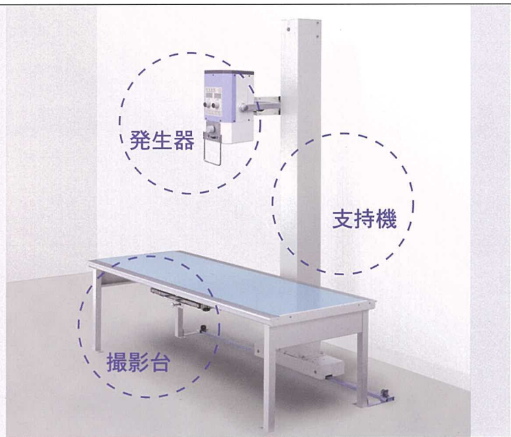
システム例1 [発生器 (PORTA 100HF) + 支持器 + 撮影台]