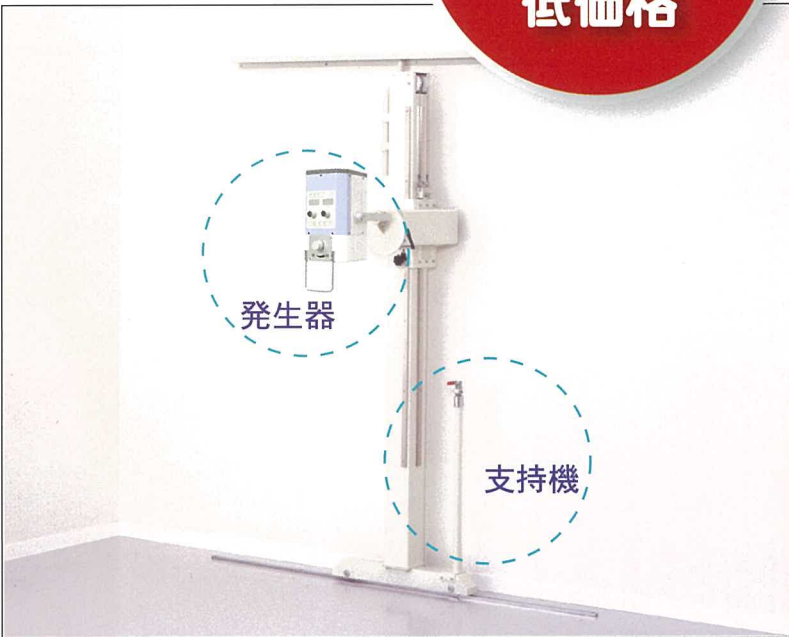
システム例2 [発生器 (PORTA 100HF) + 支持器]